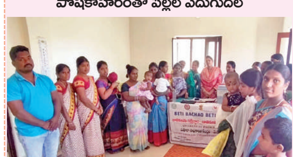
చందంపేటలో గ్రామ ఆరోగ్య పోషణ దినం జరుపుతున్న దృశ్యం