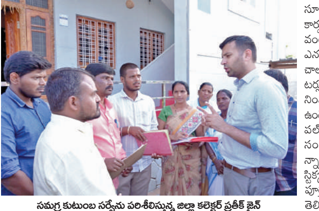
సమగ్ర కుటుంబ సర్వేను పరిశీలిస్తున్న జిల్లా కలెక్టర్ ప్రతీక జైన్

పరిగి, నవంబరు 6, ప్రభాతవార్త: రాష్ట్ర ప్రభుత్వం చేపట్టిన సామాజిక, ఆర్థిక, విద్య, ఉపాధి, రాజకీయ, కుల సమగ్ర ఇంటింటి కుటుంబ సర్వే బుధవారం ప్రారంభమైన సందర్భంగా పరిగి మున్సిపాలిటీ 5వ వార్డు, సుల్తాన్ పూర్ గ్రామ పంచాయతీలో విరాజాబాద్ జిల్లా కలెక్టర్ ప్రతీక జైన్ సమగ్ర కుటుంబ సర్వేను అభినందించారు. సర్వే చేస్తున్న అధికారులకు పలుసూచనలను దివిడి, ప్రజలు వివరాలు తెల్లించేందుకు భయపడద్దామని అవసరం లేదని, సర్వే చేస్తున్న ఎన్యూమరేటర్లకు సహకరించాలని ప్రజలకు సూచించారు. ఇంటి యజమాని, కుటుంబ సభ్యులు వివరాలను సరిగ్గా నమోదు చేయాలని, ఇంటి నెంబర్ లేని అండ్ల ఉన్యాయ, ఏమైనా సమస్యలున్నాయా అనే కుటుంబ సర్వేకు చాలా వివరాలు అడిగి తెలుసుకున్నారు. రాష్ట్ర ప్రభుత్వం తప్పగా సమాచారం