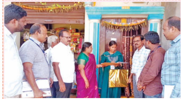
చిన్నశరణంపేటలో సర్వేను పరిశీలిస్తున్న ఆర్డీవో రమాదేవి

సర్వేకు ప్రజలు సహకరించాలి : మెడకే ఆర్డీవో చిన్నశరణంపేట, నవంబరు 6, ప్రభాతవార్త: సమగ్ర కుటుంబ సర్వేకు వచ్చే ఎన్యూమరేటర్లకు ప్రజల సహకరించాలని మెడకే ఆర్డీవో రమాదేవి సూచించారు. చిన్నశరణంపేటలో బుధవారం ప్రారంభమైన సామాజిక, ఆర్థిక, విద్య, ఉపాధి, రాజకీయ మొదలగు సమగ్ర ఇంటింటి సర్వేను పరిశీలించారు. సర్వేలో అధికారులు వివరాలు పక్కర్పాటిగా చేపట్టాలని, రాష్ట్ర ప్రభుత్వం ప్రతిష్టాత్మకంగా చేపడుతున్న సర్వేను ప్రతి ఒక్కరు సహకరించాలని కోరారు. అధికారులు వచ్చిన సమయానికి కుటుంబసభ్యుల్లో ఒకరైనా ఇంటి వద్ద ఉండి వివరాలు సమోచితముగా చెప్పాలని, ఆదార్, రేషన్ కార్డులను అందుబాటులో ఉంచుకోవాలని తెలిపారు.